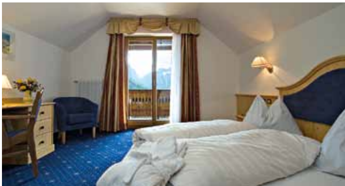
Vista Dolomiti // Dolomitenblick