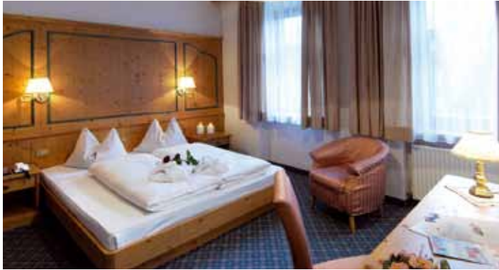
Camera doppia comfort // Doppelzimmer Komfort