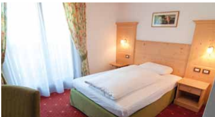
Camera Singola con balcone // Einzelzimmer mit Balkon