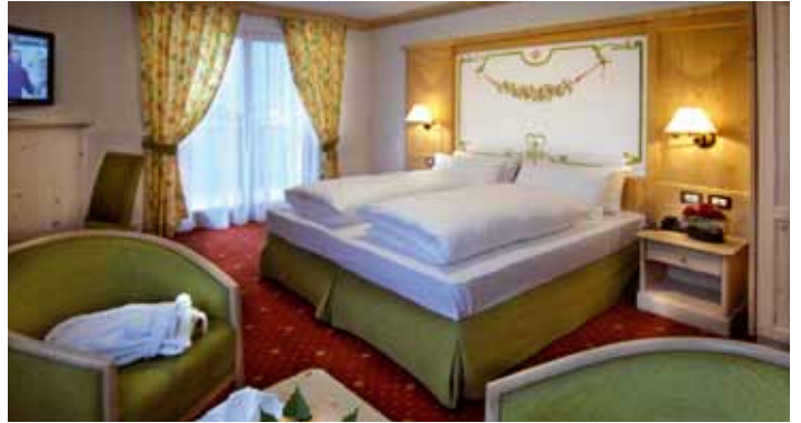
Cima nove // Neunerkofel